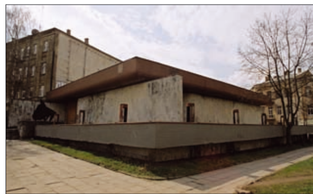
17 pav. Alaus restoranas „Tauro ragas“, (arch. E. Gūzas, A. Mačiulis) 1974 m. (nuotrauka G. Ilgūno)

„Merkurijus“ – Kauno Laisvės alėjos simbolis (18 pav.). Pagrindinė problema ir būsimos radikalios rekonstrukcijos priežastis – pastato tūris, esant didelių prekybos centrų poreikiui, pernelyg mažas ir nebeati-