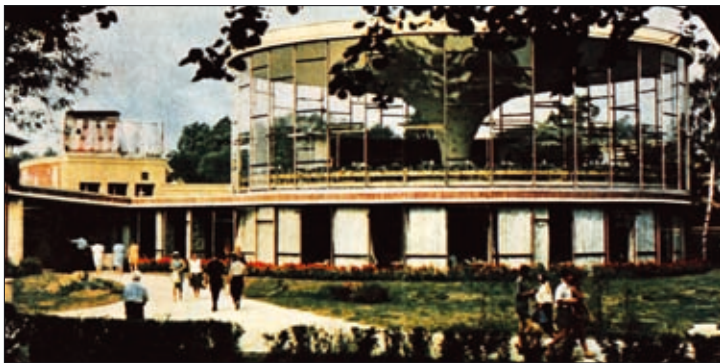
Figs. 7, 8. Hotel “Turistas” in Vilnius (arch. J. Šeibokas) in 1978 and 2008