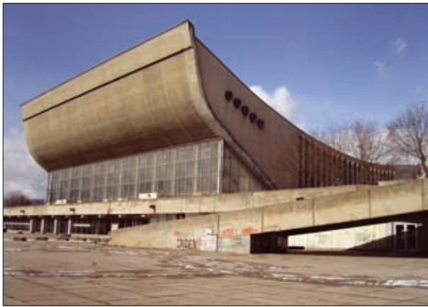
21 pav. Vilniaus koncertų ir sporto rūmai (arch. E. Chlomauskas, J. Kriukelis, Z. Liandzbergis) 1971 m.

Fig. 21. Palace of Sports and Culture in Vilnius (arch. E. Chlomauskas, J. Kriukelis, Z. Liandzbergis) built in 1971