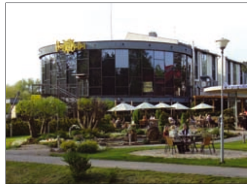
9, 10 pav. Restoranas „Vasara“ Palangoje (arch. A. Eigirdas) 1964 m. ir dabar (9 pav. paimtas iš Švyturys, 1966 m. gegužės 9 d.; 10 pav. nuotrauka A. Gabrėno)