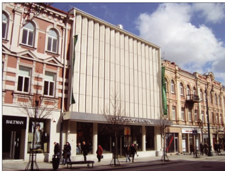
3, 4 pav. Kino teatras „Vilnius“ Vilniuje (arch. J. Kasperavičius, C. Strimaitis) 1963 m. ir dabar (3 pav. paimtas iš J. Minkevičius. Architecture of the soviet Lithuania . Maskva: Stroiizdat, 1987; 4 pav. nuotrauka G. Ilgūno) Figs. 3, 4. Cinema “Vilnius” in Vilnius (arch. J. Kasperavičius, C. Strimaitis) in 1963 and 2008