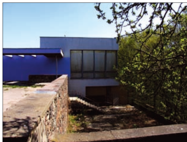
5, 6 pav. Kavinė „Trys mergelės“ Kaune (arch. A. and V. Jakučiūnai) 1967 m. ir dabar (5 pav. paimtas iš Lietuvos architektai/LAS . Vilnius: Lietuvos dailės akademijos leidykla, 2000; 6 pav. nuotrauka autorės) Figs. 5, 6. Cafe “Trys mergelės” in Kaunas (arch. A. and V. Jakučiūnai) in 1967 and 2008

„Trijų mergelių“ kavinė Kaune (5, 6 pav.) laikoma vienu stilingiausių sovietinio laikotarpio architektūros pavyzdžių. Išėstas pastato siluetas su virš upės kabančiu tūriu, stiprus ir organiškas interjero ryšys su gamta yra didžiausia kavinės autorių sėkmė. Šiandien „Trys mergelės“ rekonstruojamos, keičiamas interjeras. Visus langus aklina uždengę gipso konstrukcijos. Pertinkuojant fasadą suardytas ankstesnis horizontalus jo skaidymas. Šiuo metu pastatas apleistas. Ryškiai violetiniai fasadai jo nepuošia.