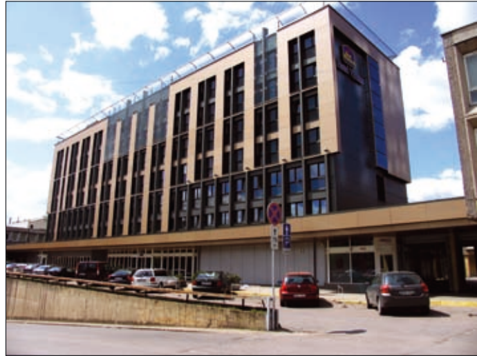
7, 8 pav. Viešbutis „Turistas“ Vilniuje (arch. J. Šeibokas) 1978 m. ir dabar (7 pav. paimtas iš katalogo Vilnius . Vilnius: Mintis, 1980; 8 pav. nuotrauka autorės)