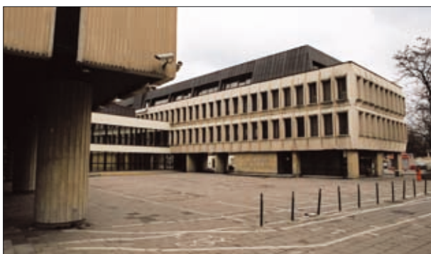
19 pav. Ryšių ministerijos objektų kompleksas (arch. J. Šeibokas) 1978–1979 m.