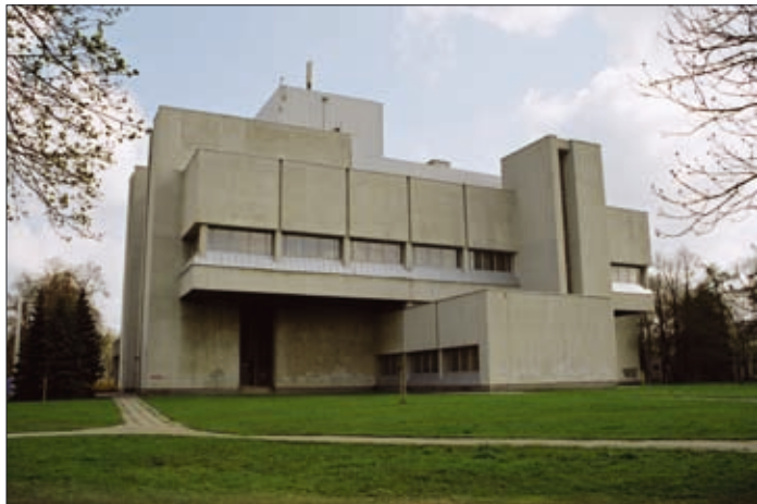
1, 2 pav. Sporto ir pramogų rūmai Vilniuje (arch. A. Mačiulis) 1983 m. ir dabar (1 pav. paimtas iš J. Minkevičius. Architecture of the soviet Lithuania . Maskva: Stroizdat, 1987; 2 pav. nuotrauka G. Ilgūno) Figs. 1, 2. Sports and Entertainment Palace in Vilnius (arch. A. Mačiulis) in 1983 and 2008

riniai ir išskiriami praradimai, kurie suvokiami fizine prasme – kaip objektų transformacijos, renovuojant, rekonstruojant ar kitaip keičiant pradinį pavidalą. Analizuojant Lietuvos modernizmo architektūros būklę, t. y. originalią pastatų išvaizdą lyginant su dabartine, didžiausi pokyčiai suskirstyti į keletą grupių, apie kurias ir kalbama šiame straipsnyje. Pateikiami tik kai kurie – būdingiausi pavyzdžiai, leidžiantys padaryti išvadą apie esamą padėtį. Jie turėtų iliustruoti esamą Lietuvos sovietmečio modernizmo architektūros būklę ir implikuoti tolesnio elgesio su ja sprendimus, kurie liečia ne tik konkrečių pastatų paveldo sąrašus, bet ir vertingųjų savybių apsaugos ir elgesio su jomis gaires.