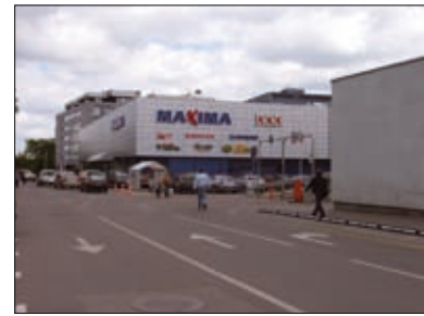
15, 16 pav. Baldų parduotuvės paviljono pastatas Vilniuje (arch. E. N. Bučiūtė) 1974 m.; rekonstruotas 1990 m. (15 pav. paimtas iš Statyba ir architektūra , 1968/6; 16 pav. nuotrauka autorės)