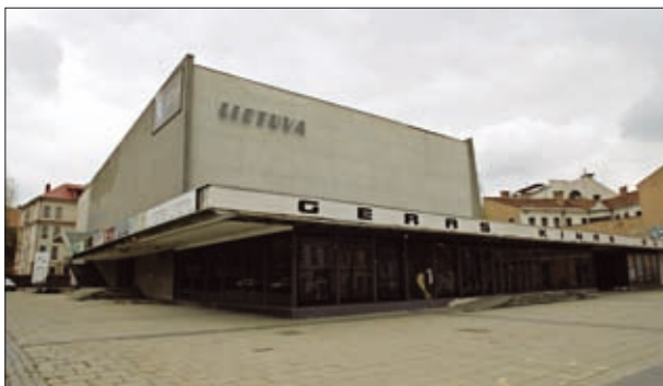
20 pav. Kino teatras „Lietuva“ Vilniuje (arch. J. Kasperavičius) 1959–1965 m.