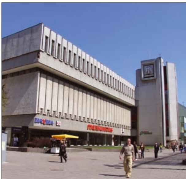
18 pav. Parduotuvė „Mercurijus“ Kaune (arch. A. Sprindys) 1982 m.