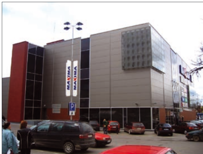
13, 14 pav. Baldų parduotuvė „Klevas“ Panevėžyje (arch. N. Grabliauskienė) 1970 m. ir dabar (13 pav. paimtas iš L. Skrebė. Panevėžys . Vilnius: Mintis, 1984; 14 pav. nuotrauka I. Račkausko)

Figs. 13, 14. Furniture Store “Klevas” in Panevėžys (arch. N. Grabliauskienė) in 1970 and 2008